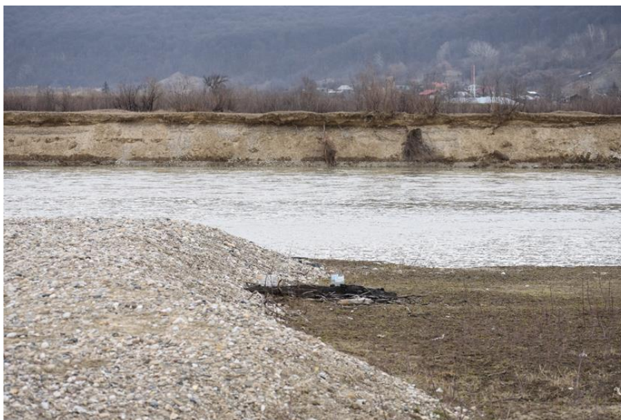
Eroziuni ale malurilor râului Siret în ROSACI0434