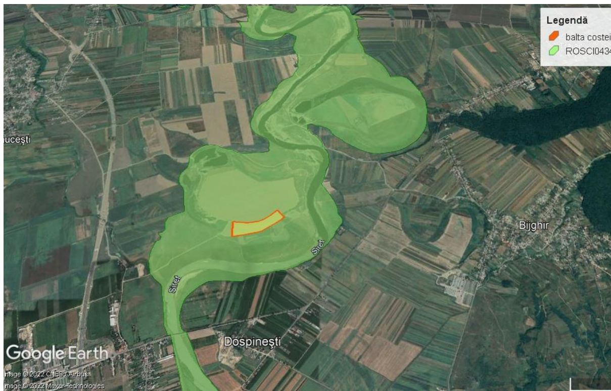
Încadrarea în ROSCI 0434 a amplasamentului proiectului