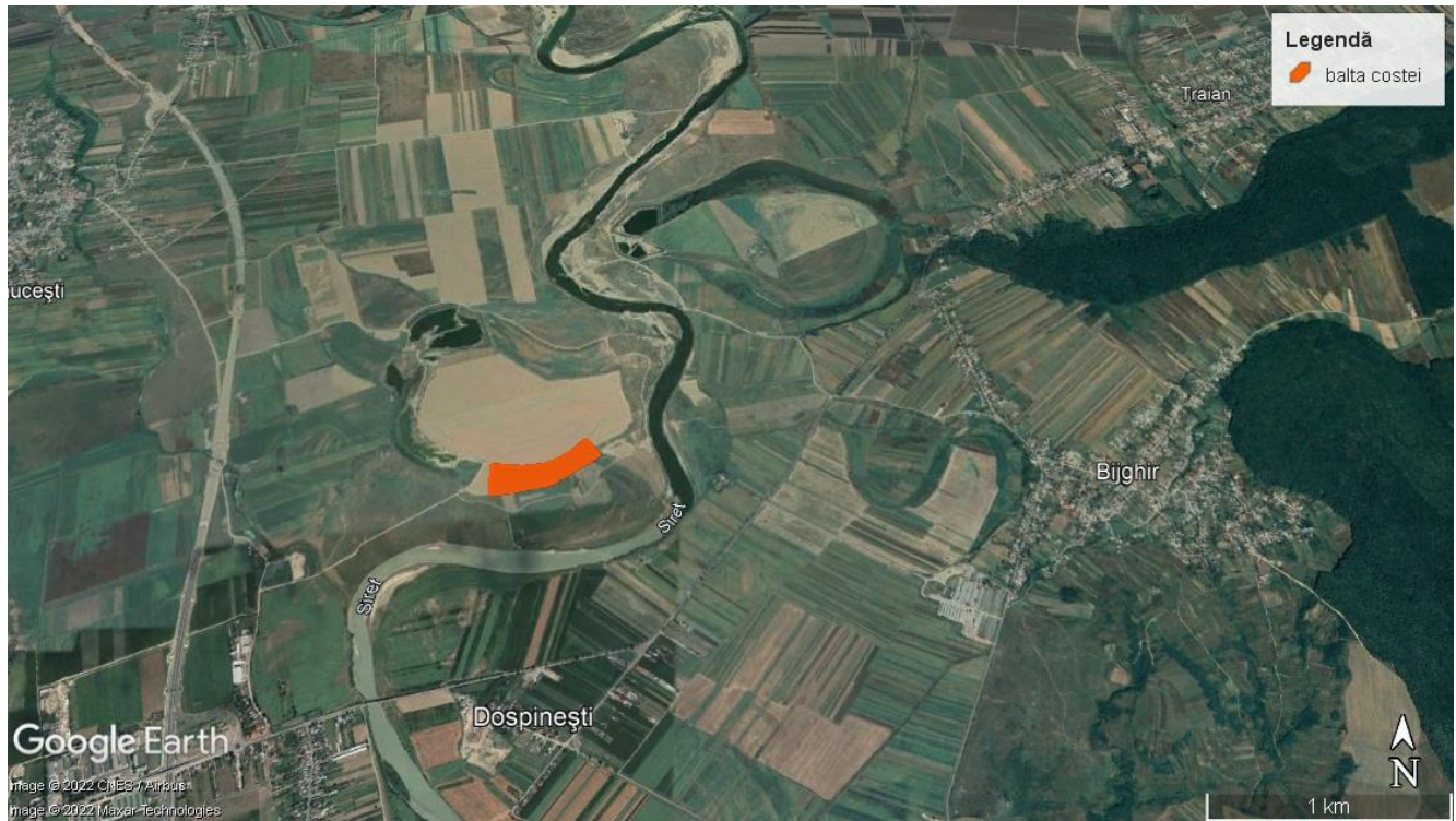
Amplasamentul proiectului extindere decolmatare Balta Costei