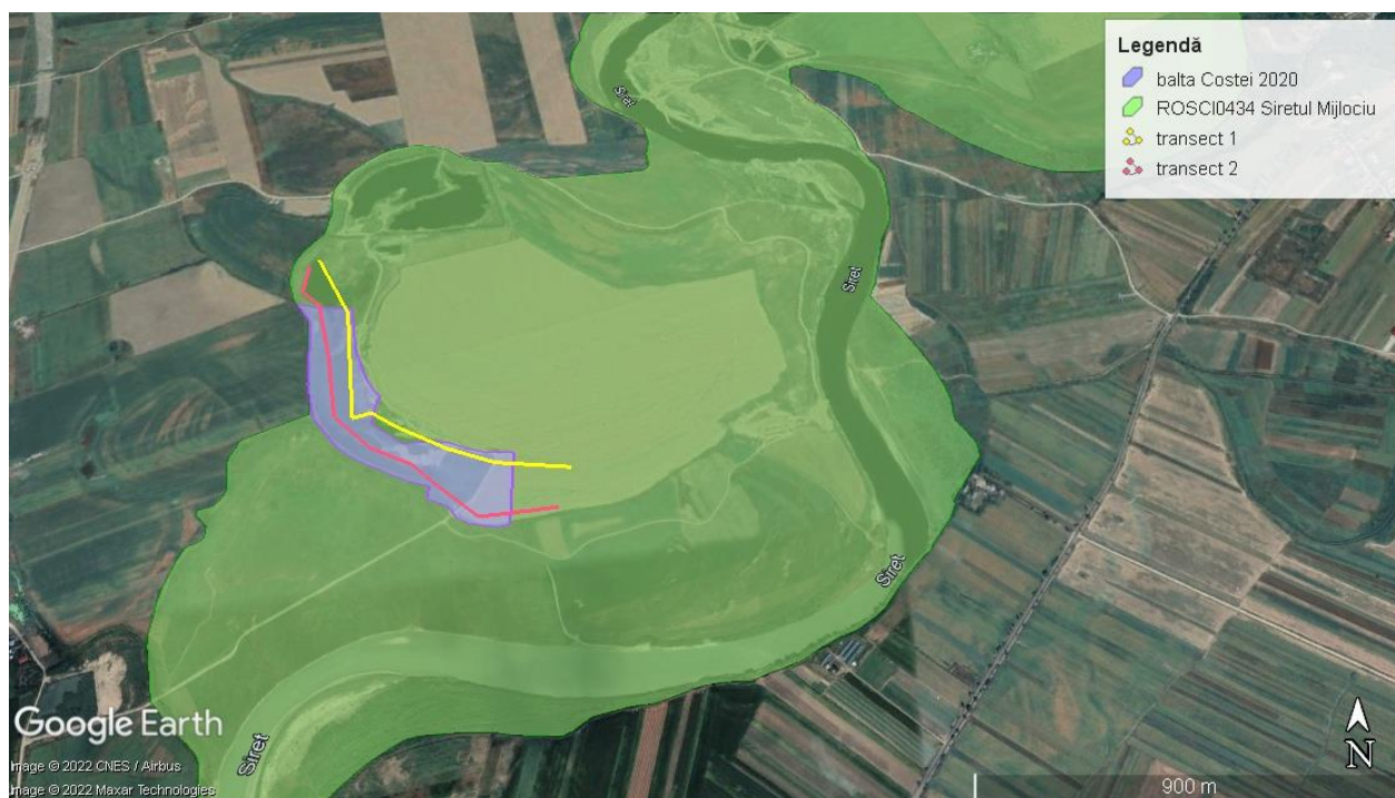
Transectele utilizate la monitorizarea speciei Emys orbicularis pe suprafața proiectului „Decolmatăre balta Costei”