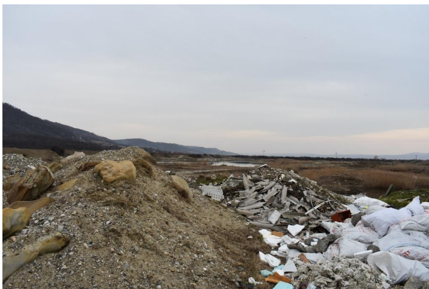
Deșeuri depozitate ilegal în ROSACI0434