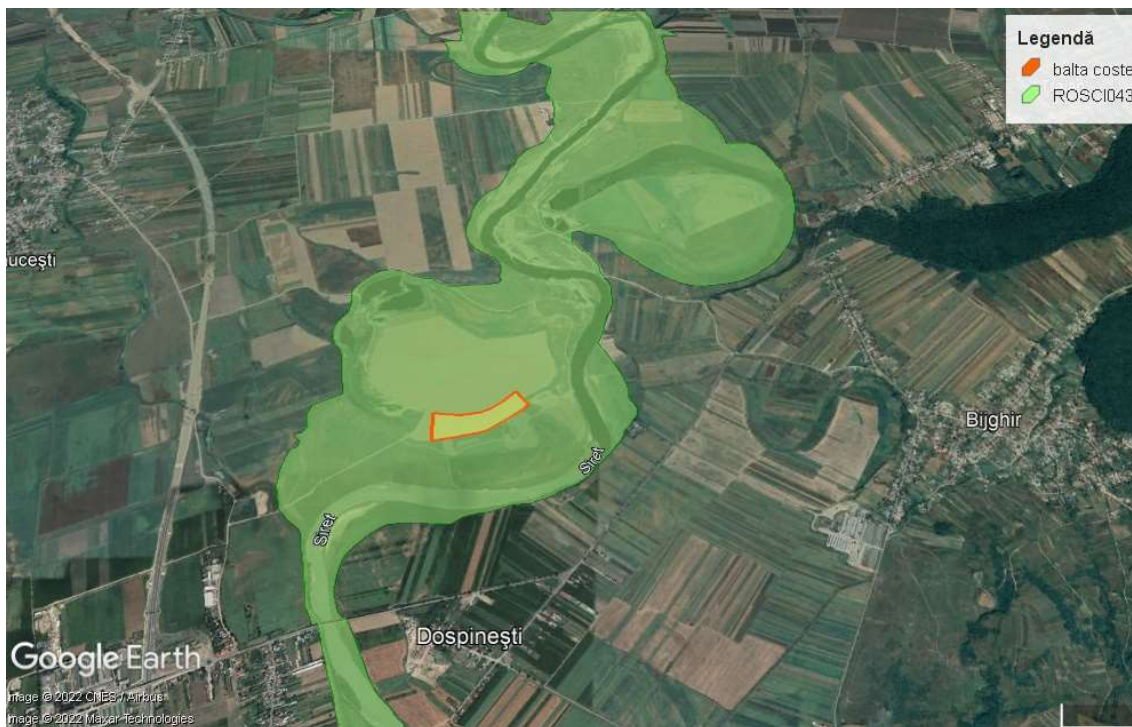
Încadrarea în ROSCI 0484 a amplasamentului proiectului