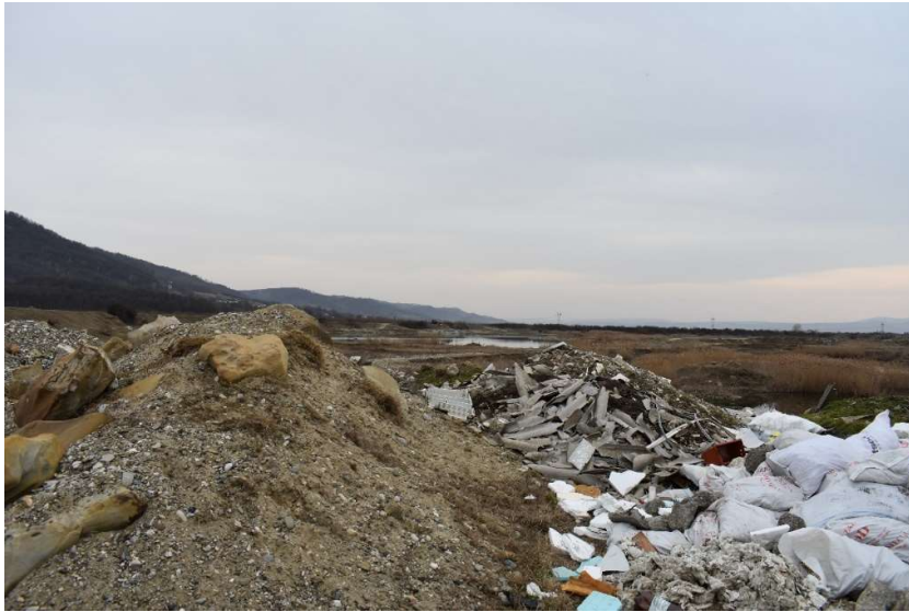
Deșuri depozitate ilegal în ROSACI0434