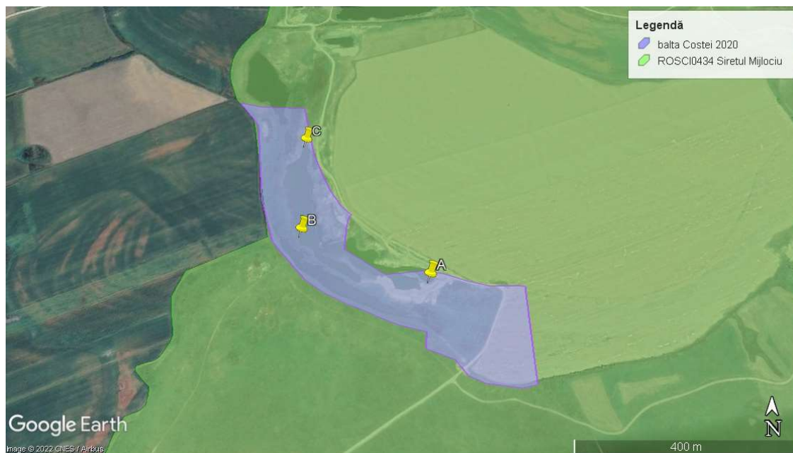
Punctele utilizate pentru monitorizarea speciei Lutra lutra pe suprafața proiectului „Decolmatare balta Costei”