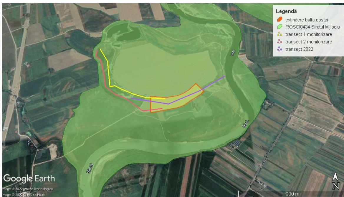
Transectele utilizate la monitorizarea speciei Emys orbicularis pe suprafața proiectului „Decolmatarea balta Costei” și identificării prezenței pe suprafața amplasamentului propus pentru extindere