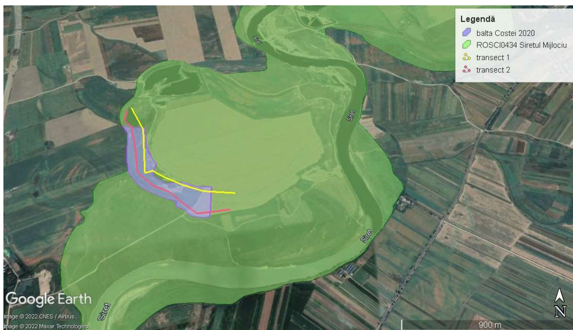
Transectele utilizate la monitorizarea speciei Emys orbicularis pe suprafața proiectului „Decolmatăre balta Costei”