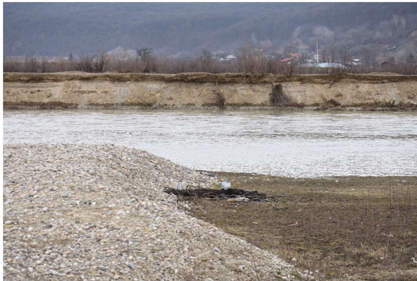
Eroziuni ale malurilor râului Siret în ROSACI0434