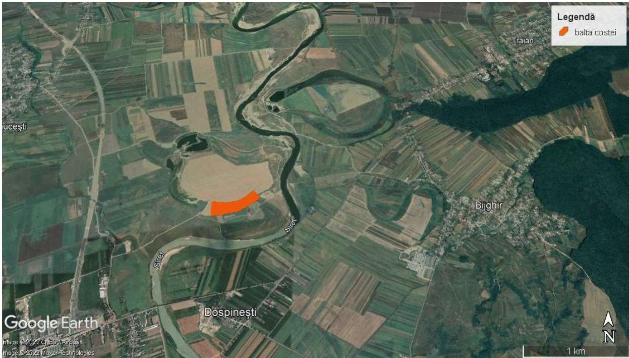
Amplasamentul proiectului extindere decolmatare Balta Costei