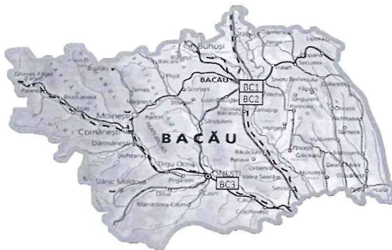
Fig. 1. Amplasarea stațiilor automate de monitorizare care aparțin RNMCA în județul Bacău