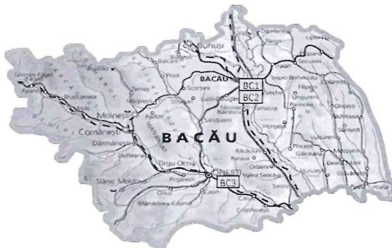
Fig. 1. Amplasarea stațiilor automate de monitorizare care aparțin RNMCA în județul Bacău